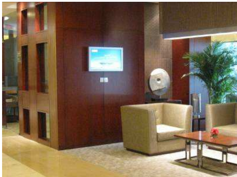
Lobby de Torre 7