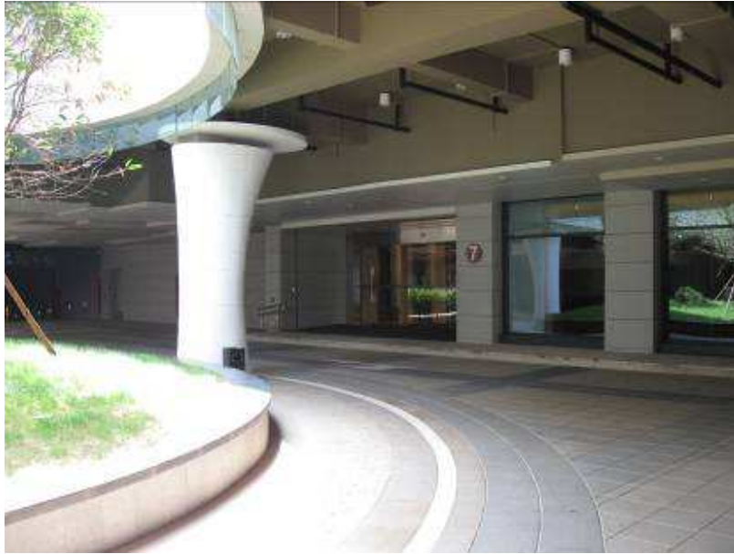
Entrada de autos