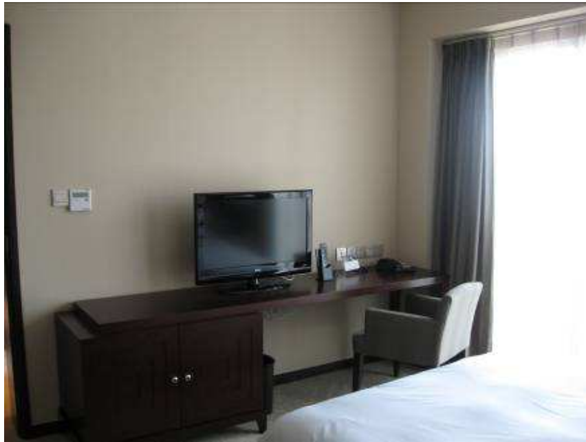
Dormitorio cama matrimonial