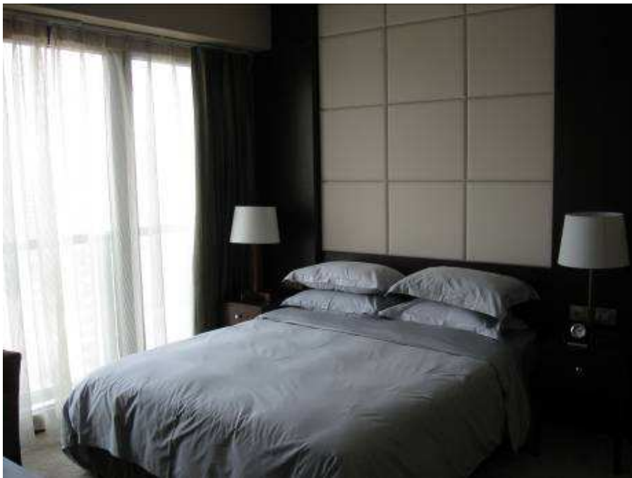
Dormitorio cama matrimonial