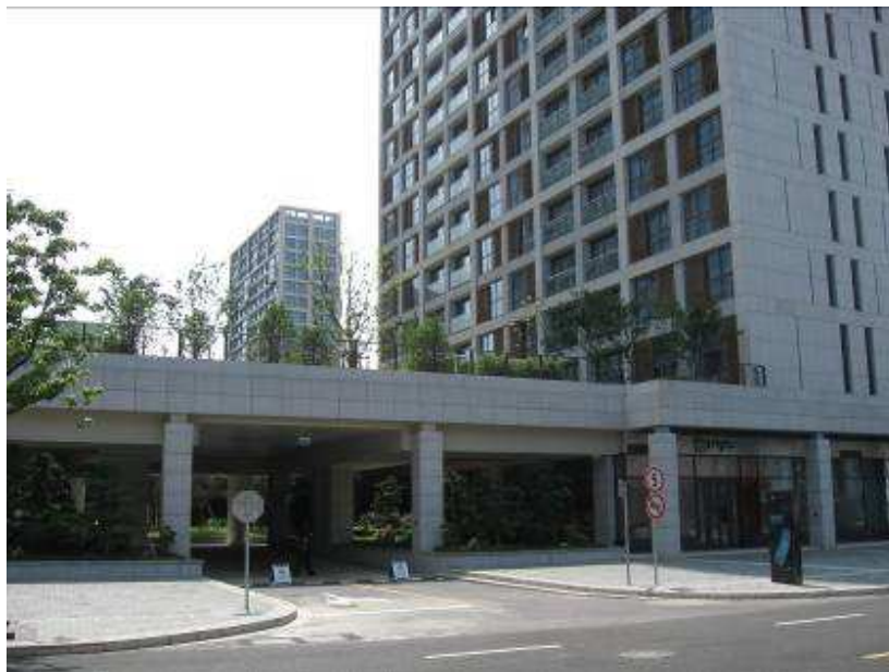
Entrada al edificio

Dirección de la villa, hay que tener la foto en el celular o en la máquina fotográfica ya que los choferes de taxi no hablan ingles.