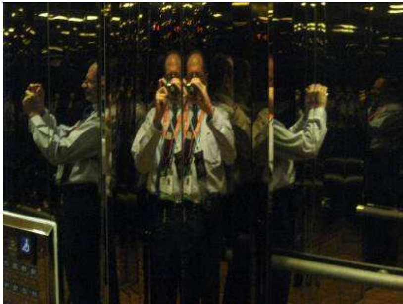
Viajando en ascensor (24 pisos cada torre)