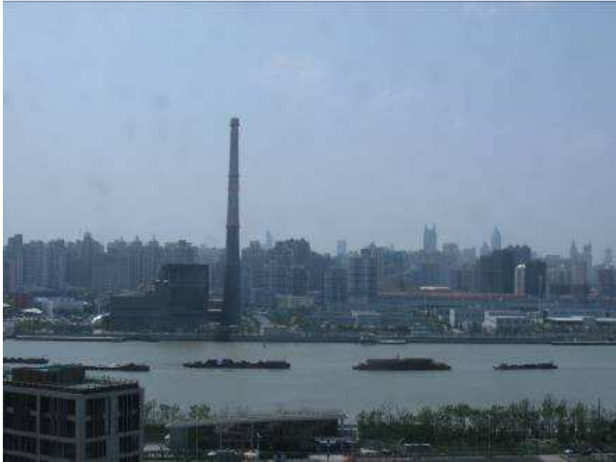
Vista desde dormitorio y living