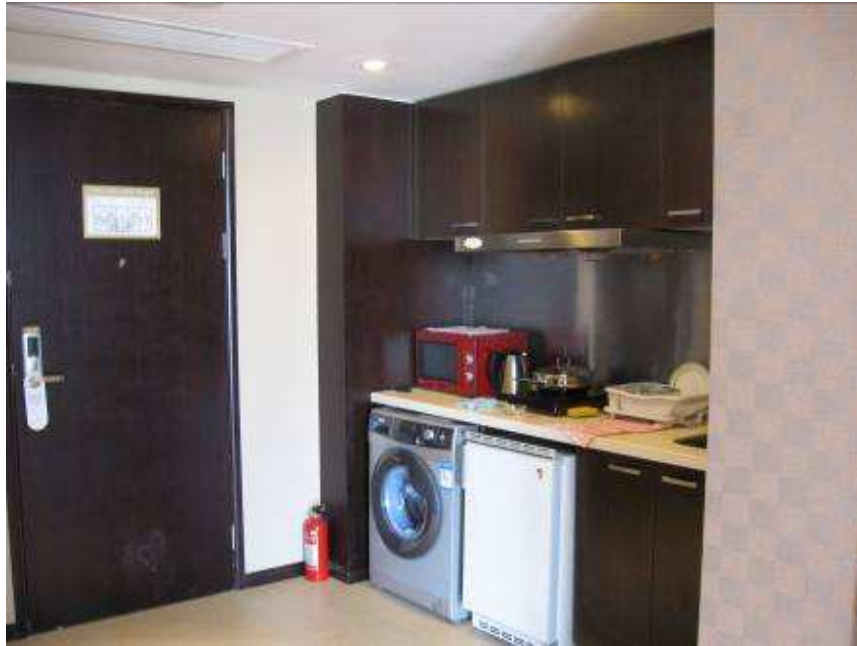
Cocina totalmente equipada