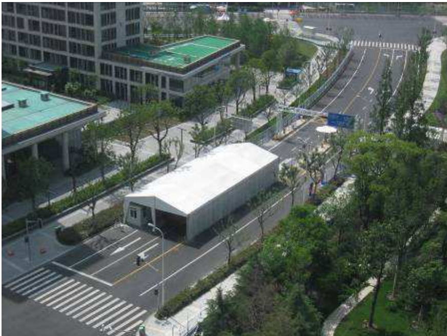
Control de seguridad para entrar desde el Intercontinental a la Villa