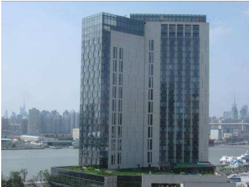
Vista del Hotel Intercontinental desde la ventana