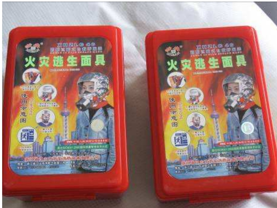
Mascaras de gas para evacuar el apartamento en caso de incendio