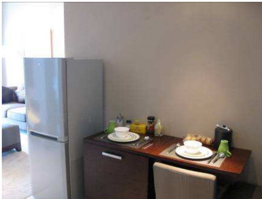
2da heladera, mesa y guarda vajilla