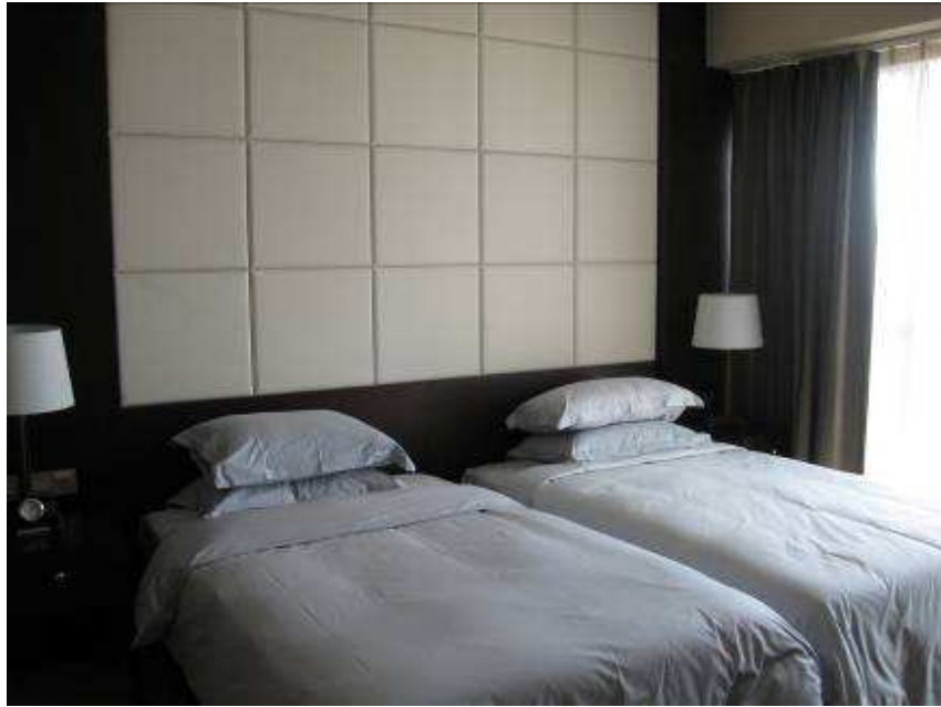
Dormitorio 2 camas