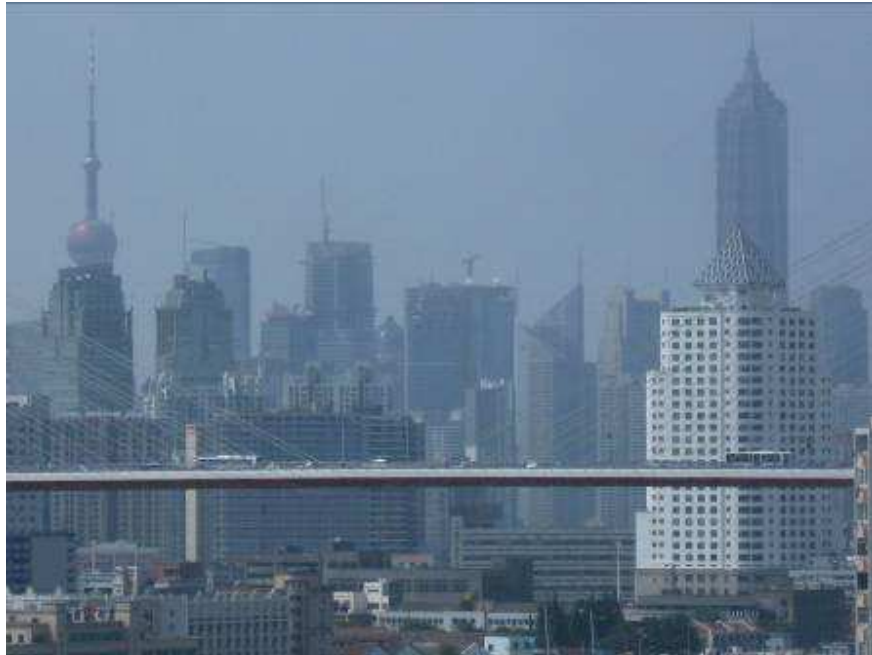
Vista desde dormitorio y living