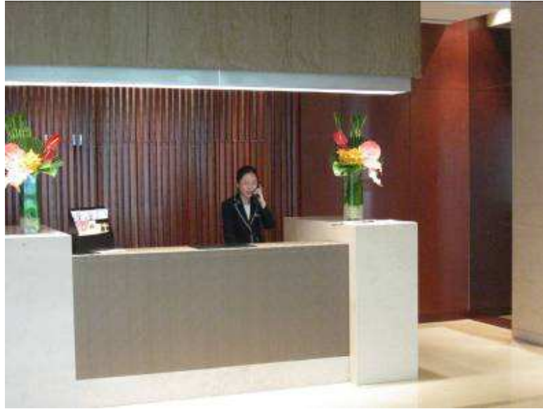
Recepción de la Torre 7, la general para registrarse esta en la Torre 4