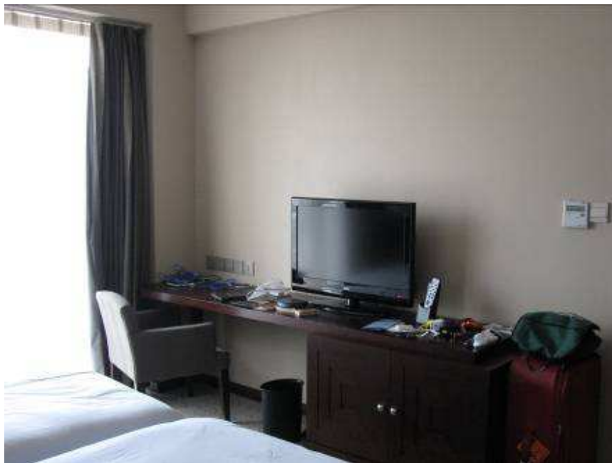
Dormitorio 2 camas