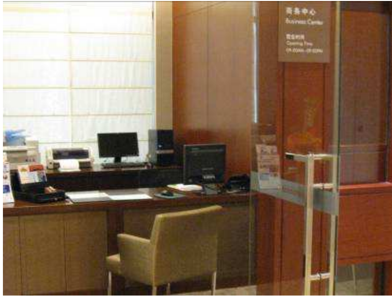
Business Center de Torre 7