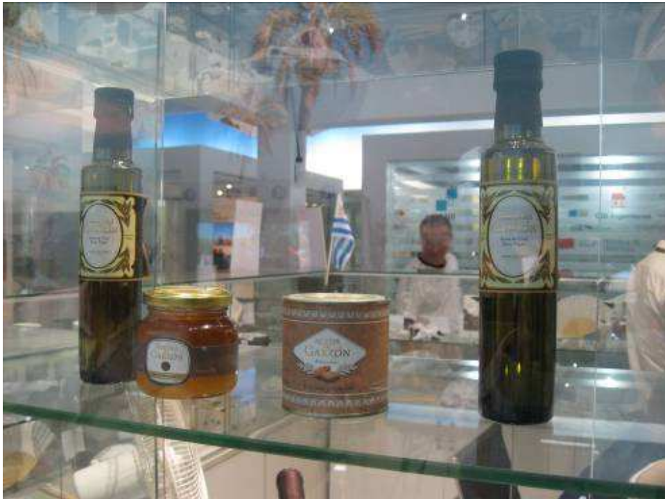
Productos de Agroland expuestos en la boutique del stand.

Agroland tiene una importante presencia en el stand de Uruguay en la Expo Universal de Shanghái. En una de las pantallas con auriculares a disposición del público visitante, permanentemente se proyecta un video que relata las principales actividades del Complejo Agro-Industrial-Turístico, y en la boutique se exponen los productos producidos en Garzón como el Aceite de Oliva, las Almendras y la Miel de Trébol Blanco