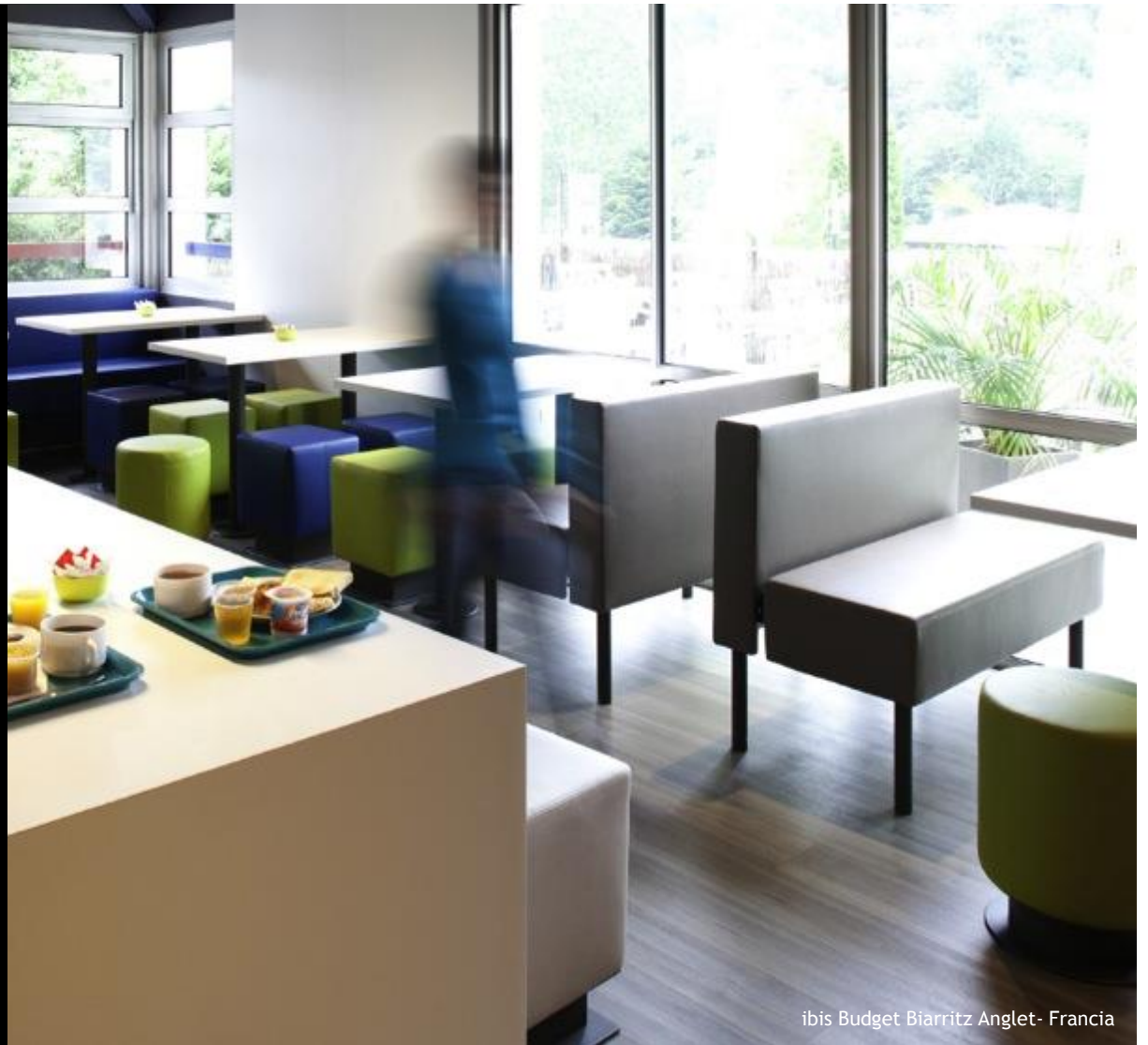
ibis Budget Biarritz Anglet- Francia